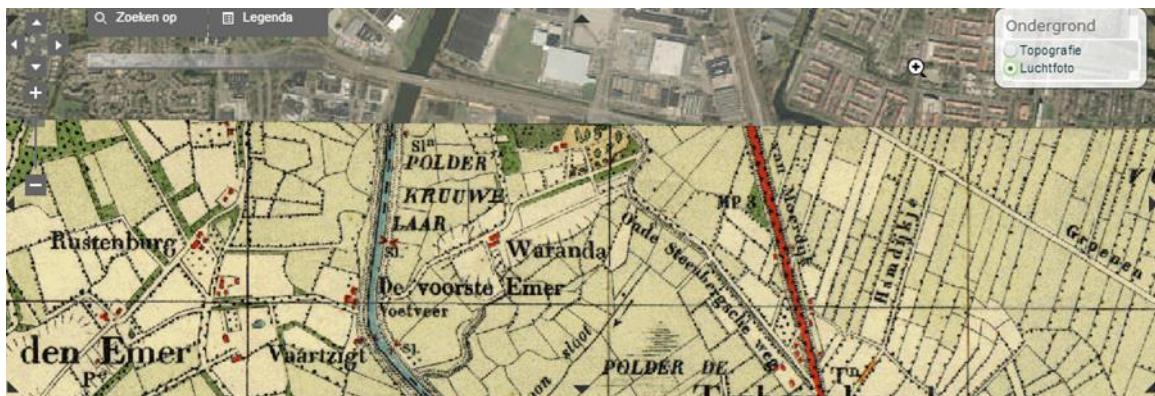
Figuur 1 Topografische kaart 1910-1920/bovenste deel huidige luchtfoto

Het laat me niet los en ik ga eens op digitale speurtocht naar de geschiedenis van het terrein. De oude topografische kaart van rond 1910 laten een zandophoging zien en de naam Waranda, bij een boerderij en zelfs een heide-terreintje en wat bosjes. Zou het zomaar kunnen dat dit plukje hei, deze paar bomen en dat bosje, restanten zijn van een oud rivierduintje, intact gebleven te midden van opgespoten polders? Zitten deze heksenkringen hier al eeuwenlang in de grond? Het vraagt om verder onderzoek.