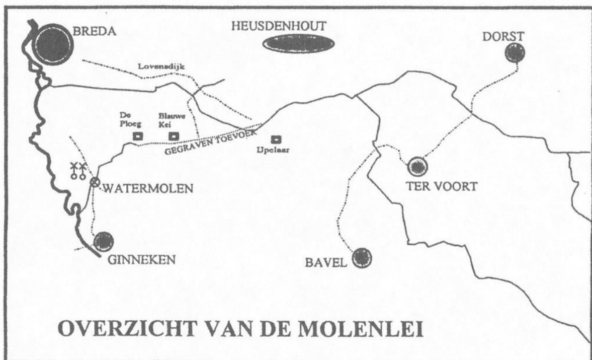
Figuur 1 gegraven toevoer naar Watermolen in het Ginneken

De Molenleij zou in het derde kwart van de 13e eeuw gegraven zijn, als aftakking van de Rulle. Dit ten behoeve van een te bouwen watermolen aan de Ginnekenweg. Over de loop van de Rulle is weinig met zekerheid bekend. (lit. 1)