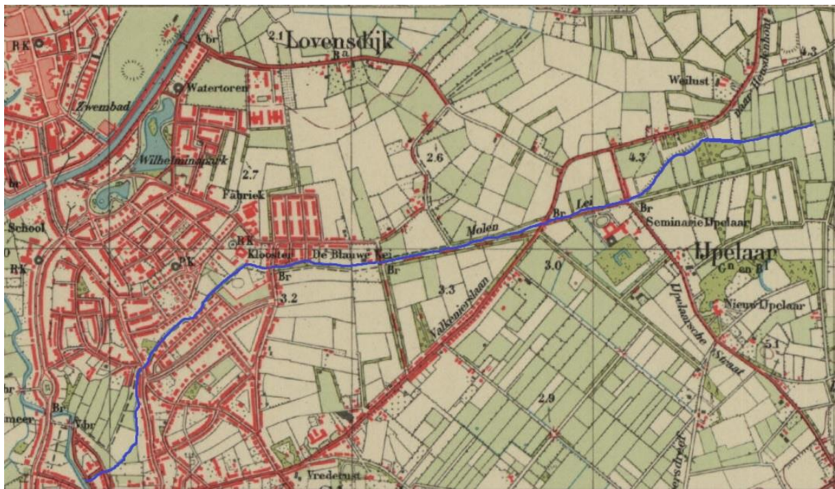
Figuur 3 Loop Molenleij topografische kaart 1940

Molenleij liep er doorheen. Een bruggetje in de Regentesselaan spoelde finaal weg. (lit. 3). Figuur 3 geeft de loop weer op een topografische kaart uit 1940.